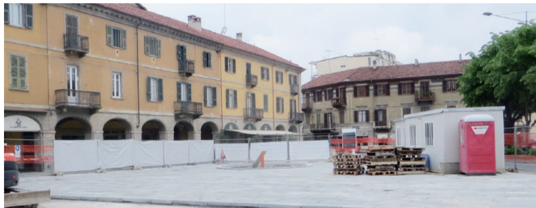
Sull'area già coperta con la pietra, lo spazio dove verrà inserita la fontana ora al centro di Piazza Garibaldi.